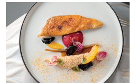
Suprême de volaille