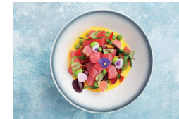
Ceviche de thon