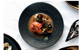
Homard aux morilles